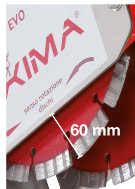
Profondità fino a 60 mm